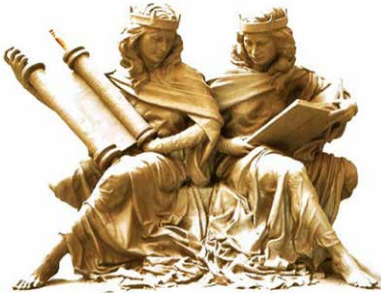
MODERNE SKULPTUR SYNAGOGUE UND ECCLESIA

EINLADUNG ZUR GEMEINDETAGUNG DER DEKA IM ALGARVE VOM 23. – 25. SEPTEMBER 2022